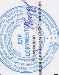
График проведения генеральных уборок с применением средств дезинфекции